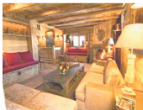
Plafonds en bois vieilli (poutres et solives)