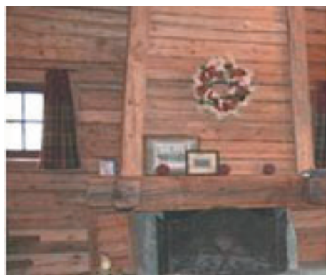
Cheminée dans chaque appartement