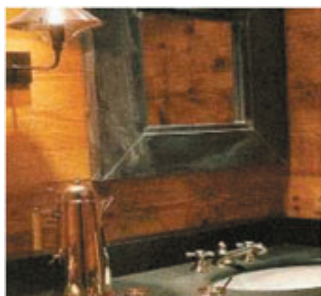
Bois et ardoise pour les salles de bain